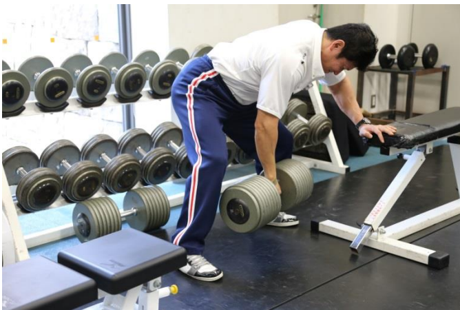
ダンベル 1kg~100 kg