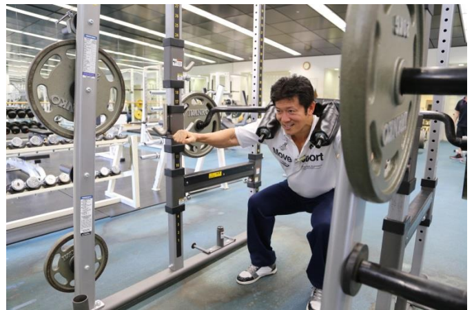
セーフティスクワット