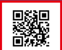
八幡屋スポーツパークセンター HP