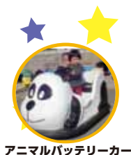
アニマルバッテリーカー

場所： 八幡屋公園・大阪市中央体育館 地下鉄中央線「朝潮橋」駅下車2-A出口よりスグ