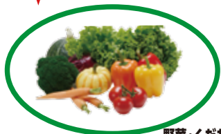
野菜・くだものマーケット