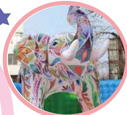
巨大!ハチノス迷路