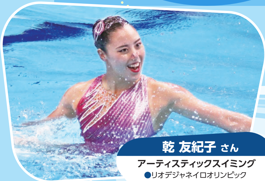
乾 友紀子 さん