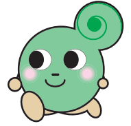
※体育館公式 マスコットキャラクター マイマイ